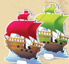
12 laeva koos alustega