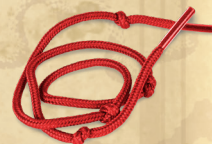
1 sõlmedega köis